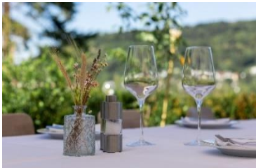
Standard Dekoration im Waldhaus (Kerzen, Standard- Tischblumen).