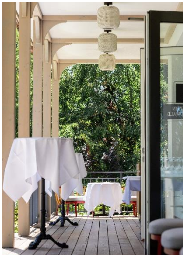
Apéro auf der Veranda