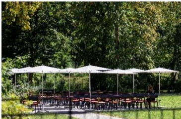
Traung auf dem Kobel