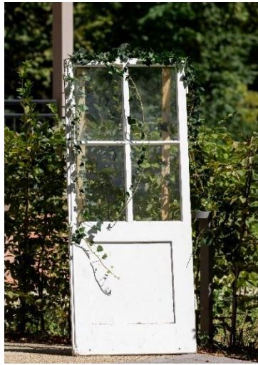
romantische Holztüre für den Gästeempfang